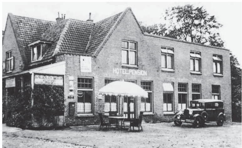
In Hotel Pension Kuiper trad toneelvereniging Advendo menigmaal op.