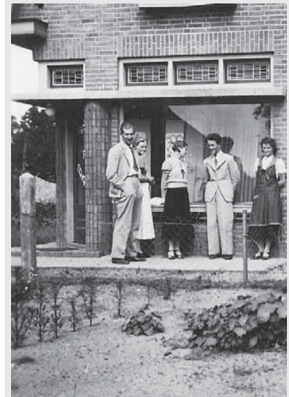
Een familiefoto voor de woning aan de Hoofdstraat