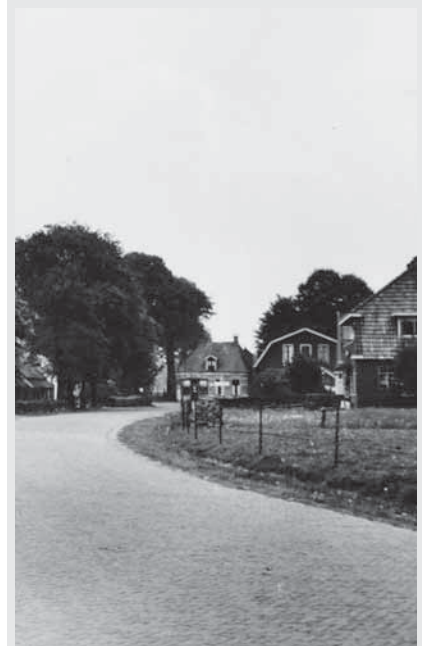
Vanaf 1938 woonde het gezin Plenter aan de Laaghalerstraat in de woning die geheel rechts nog net zichtbaar is.